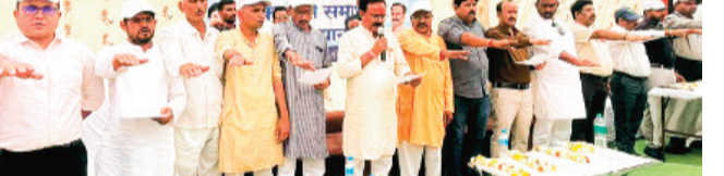
हरिभूमि न्यूज मुंगावली

जल गंगा संवर्धन अभियान 2026 एवं संकल्प से समाधान अभियान अंतर्गत गुरुवार को ग्राम पंचायत महारागढ़ में खंड स्तरीय कार्यक्रम का आयोजन विधायक मुंगावली बृजेन्द्र सिंह यादव के मुख्य आतिथ्य में किया गया। कार्यक्रम का आयोजन प्राचीन किले के अंदर रखा गया था एवं किले के पास वाले तालाब में सभी जनप्रतिनिधियों व उपस्थित अधिकारी/कर्मचारियों व ग्रामीणजनों के जनसहयोग से श्रमदान कर किले की साफ-सफाई एवं तालाब से गाद निकालने का कार्य किया गया। मुख्य कार्यपालन अधिकारी जनपद पंचायत मुंगावली जल गंगा संवर्धन अभियान